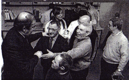
ATENCIÓN INTEGRAL A LOS MAYORES. El presidente de la Junta, Juan Vicente Herrera, presidió el lunes 4 la inauguración del Centro de Atención Integral para Personas con Discapacidad Intelectual y Envejecimiento Prematuro de Aspañias, una referencia nacional en su especialidad.