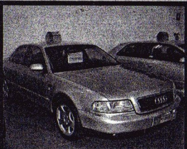
A8 2.5 TDI 180 cv Quattro Tiptron 18.995 € • Año 2001