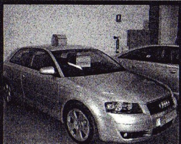
A3 1.6 100 cv Ambition 19.975 € • Año 2005

Financie con nosotros el 100% de la compra. Garantía de 12 meses y recompra hasta 48 meses