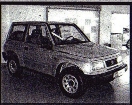
Suzuki Vitara 2.0 HDI Super L 90 cv Techo metal 11.995 € • Año 2004