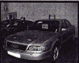
A8 3.7 230 cv Quattro Tiptronic 11.995 € • Año 1998